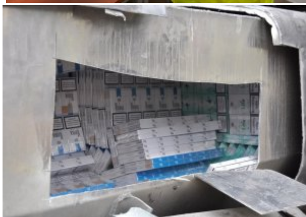
Ujawnione papierosy w skrytkach pojazdu