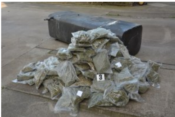
Ujawniona marihuana w zbiorniku paliwa