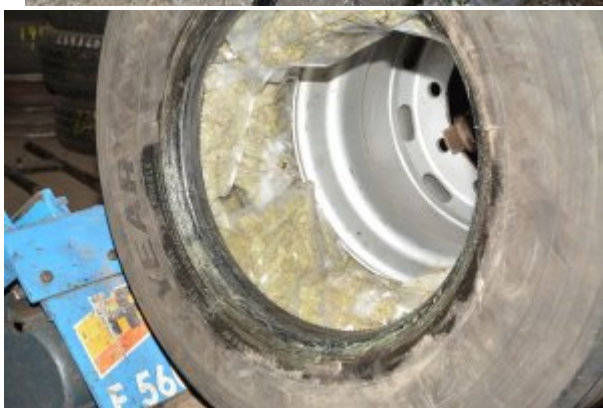
Ujawniona marihuana w kołach zapasowych