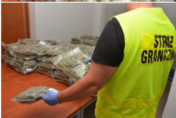
Ujawniona marihuana w zbiorniku paliwa