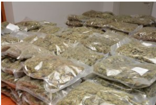
Ujawniona marihuana w zbiorniku paliwa