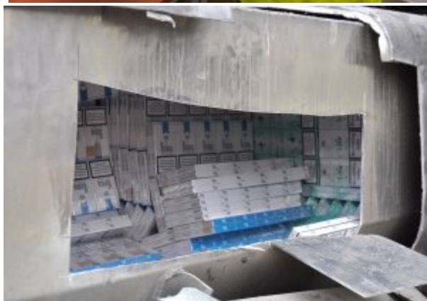
Ujawnione papierosy w skrytkach pojazdu