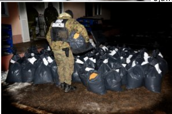
Ujawniona krajanka tytoniowa