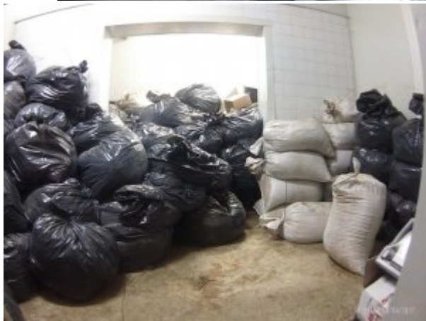
ujawniona krajanka tytoniowa