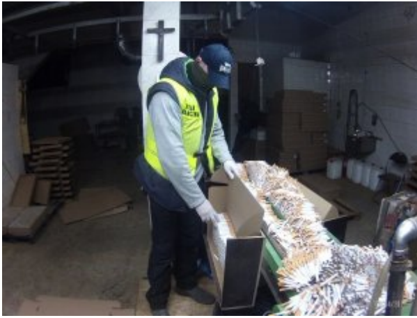
ujawnione nielegalne papierosy