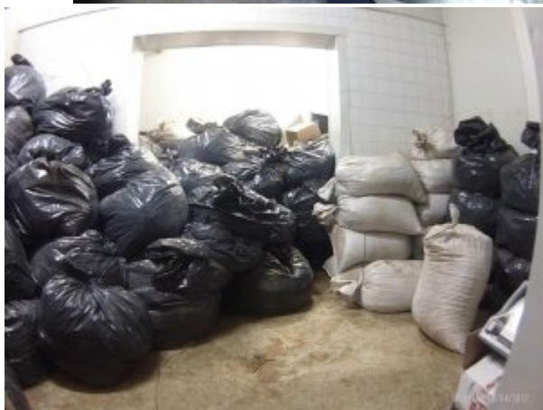
ujawniona krajanka tytoniowa