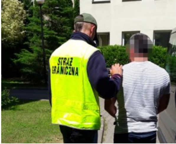
zatrzymany obywatel Gruzji