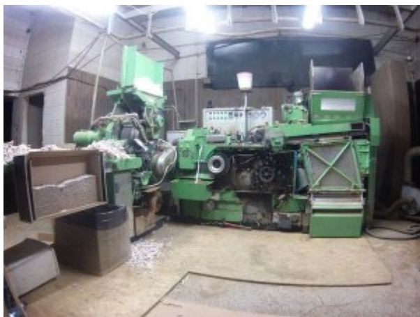
zabezpieczona linia technologiczna do produkcji nielegalnych papierosów

nielegalnych papierosów o wartości prawie 600 tys. zł. Ponadto w samochodach znajdujących się na posesji i halach magazynowych znaleziono półprodukty do wytwarzania papierosów, m. in. gilzy papierosowe, rolki papierowe, kartki z nadrukami nazw wyrobów tytoniowych. Wszystkim postawiono wówczas zarzut udziału w zorganizowanej grupie przestępczej mającej na celu nielegalną produkcję papierosów.