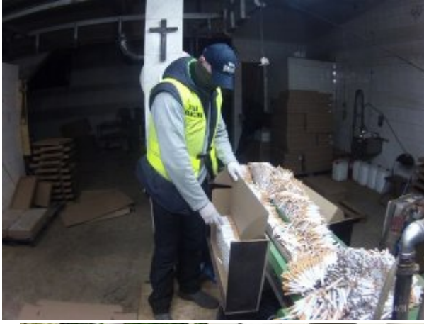
ujawnione nielegalne papierosy