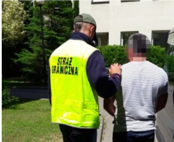
zatrzymany obywatel Gruzji