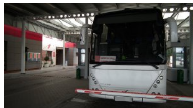
Po wpływem alkoholu kierował autobusem rejsowym

31-letni mężczyzna miał ponad 0.56 promila alkoholu w wydychanym powietrzu. Został zatrzymany i po sporządzeniu stosownej dokumentacji funkcjonariusze SG przekazali go policjantom z Braniewa.