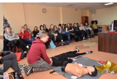
PSG w Braniewie