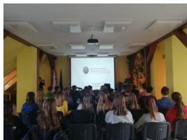
PSG w Górowie Iławeckim