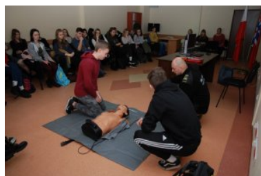
PSG w Braniewie

Natomiast funkcjonariusze z Placówki Straży Granicznej w Braniewie pokazali młodym ludziom zasady postępowania z poszkodowanymi w sytuacjach zagrożenia zdrowia i życia ludzkiego. Uczniowie pod okiem fachowca mieli okazję w praktyce na fantomie przećwiczyć resuscytację krążeniowo - oddechową, a także zastosować na nim Zautomatyzowany Defibrylator Zewnętrzny (AED). Bo ta wiedza jest potrzebna nie tylko ratownikom, ale każdemu człowiekowi, by uratować komuś życie.