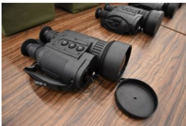
Nowoczesny sprzęt do obserwacji granicy

Nowoczesne kamery termowizyjne zostały zakupione ze środków Unii Europejskiej w ramach Programu Krajowego Funduszu Bezpieczeństwa Wewnętrznego. Natomiast pojazdy obserwacyjne z "Programu modernizacji Policji, Straży Granicznej, Państwowej Straży Pożarnej i Służby Ochrony Państwa w latach 2017-2020". Specjalistyczny sprzęt będzie wykorzystywany przez funkcjonariuszy z W-MOSG, pełniących służbę w bezpośredniej ochronie zewnętrznej granicy UE.