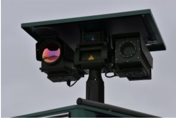
Nowoczesny sprzęt do obserwacji granicy