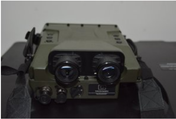
Nowoczesny sprzęt do obserwacji granicy