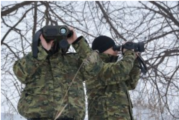
Nowoczesny sprzęt do obserwacji granicy