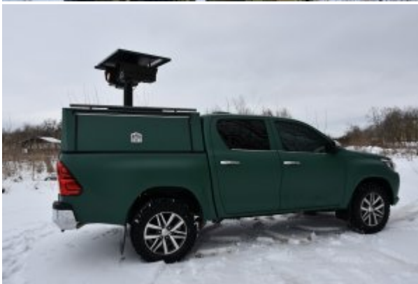
Nowoczesny sprzęt do obserwacji granicy