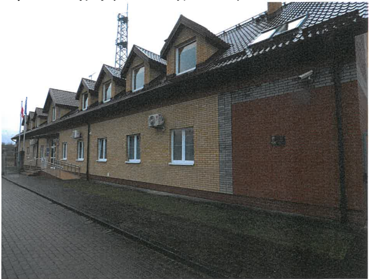
Załącznik nr 1 - Zdjęcia przykładowe ilustrujące stan obecny.