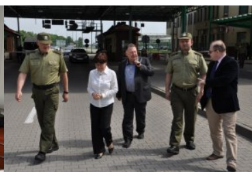
Warsztaty z zakresu VIS