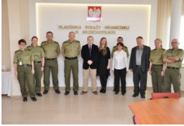
Warsztaty z zakresu VIS