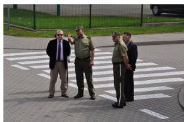
Warsztaty z zakresu VIS