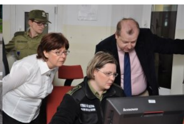
Warsztaty z zakresu VIS