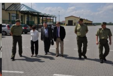
Warsztaty z zakresu VIS