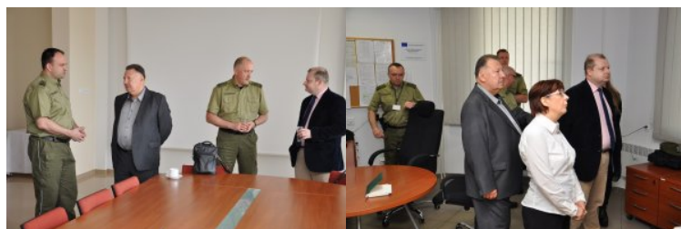
Warsztaty z zakresu VIS

Zorganizowane warsztaty pozwoliły na wymianę doświadczeń z zakresu jednolitej polityki wizowej zarówno ze strony przedstawicieli służby konsularnej oraz Straży Granicznej.