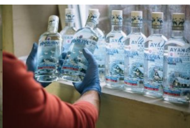
Ujawnione wyroby akcyzowe