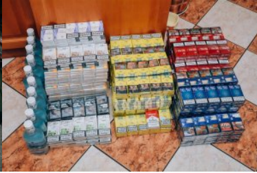
Ujawnione wyroby akcyzowe