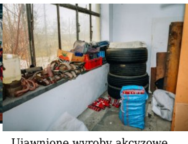
Ujawnione wyroby akcyzowe