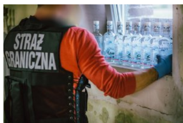
Ujawnione wyroby akcyzowe

Dalsze czynności w sprawie prowadzą funkcjonariusze W-MOSG.