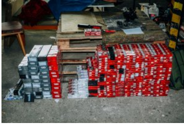
Ujawnione wyroby akcyzowe