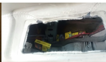
Ujawnione wyroby akcyzowe