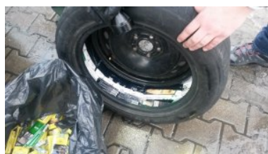
Ujawnione wyroby akcyzowe

Kilka godzin później funkcjonariusze z Bezled zatrzymali kolejne auto. Pojazdem podróżowały dwie 28-letnie osoby, mieszkańcy województwa warmińsko-mazurskiego. Nie spodziewali się oni tak wnikliwej kontroli ze strony funkcjonariuszy SG. Wyroby akcyzowe skrupulatnie pochowali pod siedzeniami kierowcy i pasażera oraz podłódze pojazdu. Wartości ujawnionych wyrobów akcyzowych to ponad 2 tys. zł.