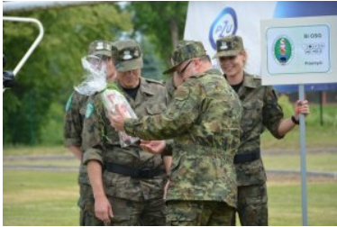
Najlepsi w Straży Granicznej