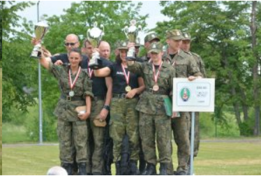
Najlepsi w Straży Granicznej