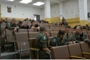
Najlepsi w Straży Granicznej