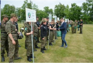
Najlepsi w Straży Granicznej