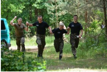
Najlepsi w Straży Granicznej