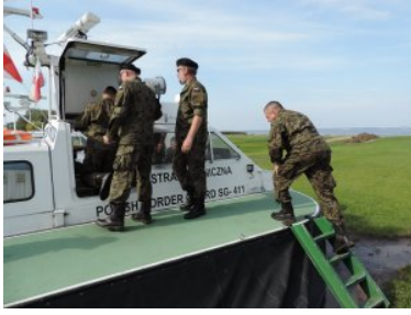
Żołnierze rezerwy z wizytą w Straży Granicznej