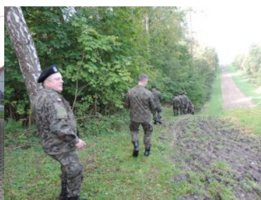
Żołnierze rezerwy z wizytą w Straży Granicznej