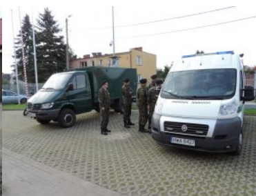
Żołnierze rezerwy z wizytą w Straży Granicznej