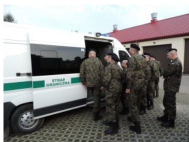
Żołnierze rezerwy z wizytą w Straży Granicznej