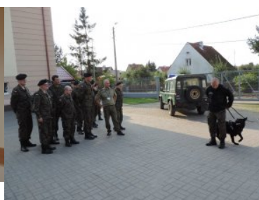
Żołnierze rezerwy z wizytą w Straży Granicznej