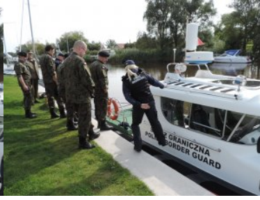
Żołnierze rezerwy z wizytą w Straży Granicznej