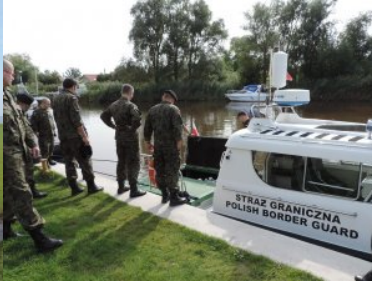
Żołnierze rezerwy z wizytą w Straży Granicznej