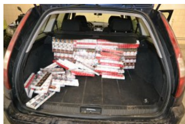
Ujawnione papierosy bez akcyzy

W dodatku mieszkaniec województwa warmińsko-mazurskiego, nie posiadał uprawnień do kierowania pojazdami mechanicznymi, za co został ukarany przez funkcjonariuszy SG, mandatem karnym w wysokości 500 zł.