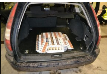
Ujawnione papierosy bez akcyzy