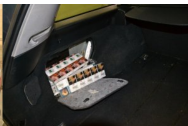
Ujawnione papierosy bez akcyzy