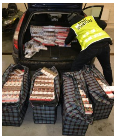
Ujawnione papierosy bez akcyzy