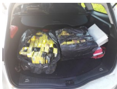
ujawnione papierosy w fordzie

Mężczyźni nielegalny towar stracili i poniosą odpowiedzialność karno-skarbową.