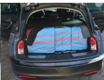
ujawnione papierosy w opelu