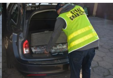
ujawnione papierosy w opelu