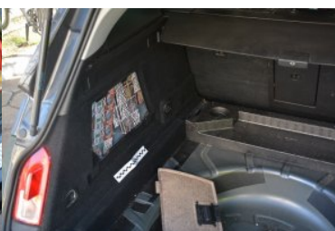
ujawnione papierosy w opelu