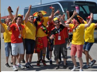
Odprawa kibiców na przejściu w Grzechotkach