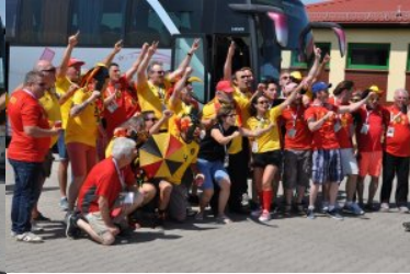
Odprawa kibiców na przejściu w Grzechotkach