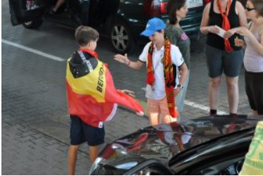
Odprawa kibiców na przejściu w Grzechotkach