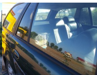
ujawnione wyroby akcyzowe