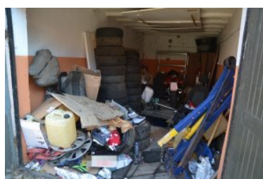
ujawnione wyroby akcyzowe