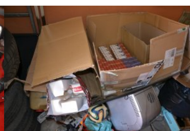
ujawnione wyroby akcyzowe