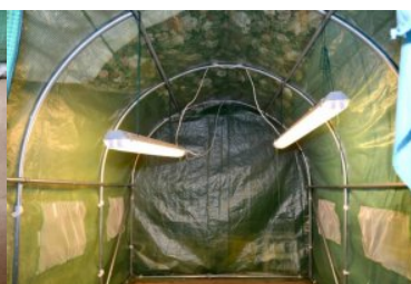
namiot w którym ujawniono marihuanę