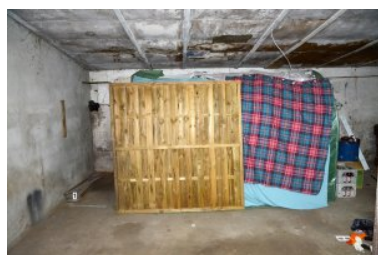
namiot w którym ujawniono marihuanę