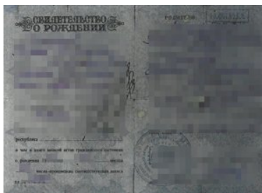
Podrobiony akt urodzenia

Mężczyzna pochodzący z Jejska (Rosja) przyznał się do zarzucanego mu czynu i dobrowolnie poddał się karze grzywny w wysokości 1 000 zł.