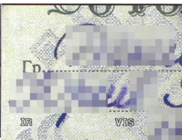
Podrobiony akt urodzenia