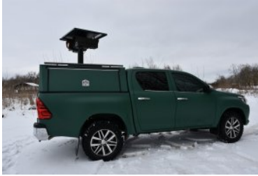
Nowoczesny sprzęt do obserwacji granicy