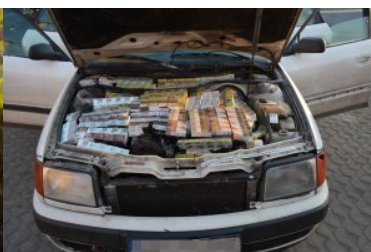
ujawnione wyroby akcyzowe