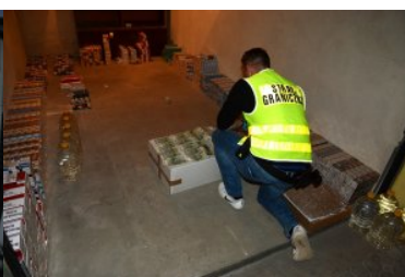
ujawnione wyroby akcyzowe