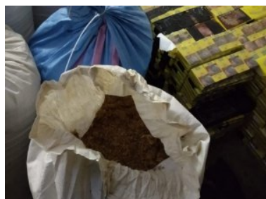
ujawnione wyroby akcyzowe

Każde podejmowane działania zarówno na przejściach granicznych jak i na drogach regionu, czy na terenie kraju miały na celu zwalczanie przemytu i niedoprowadzenie do obrotu nielegalnych wyrobów akcyzowych.