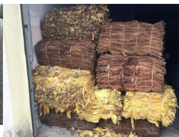
ujawnione wyroby akcyzowe