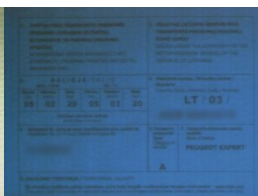
sfalszowana polisa OC