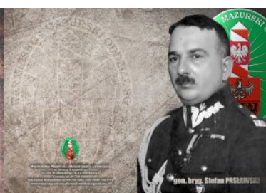
135. rocznica urodzin gen. bryg. Stefana Paślawskiego