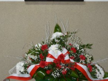
135. rocznica urodzin gen. bryg. Stefana Paślawskiego