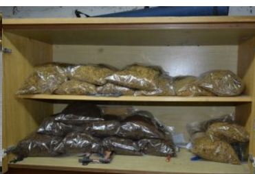
ujawnione wyroby akcyzowe