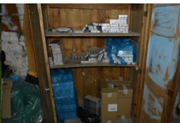
ujawnione wyroby akcyzowe