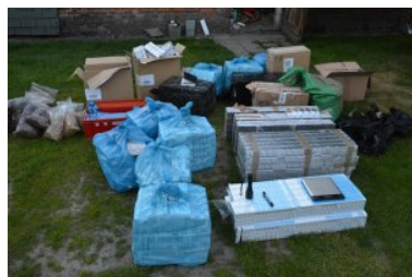
ujawnione wyroby akcyzowe