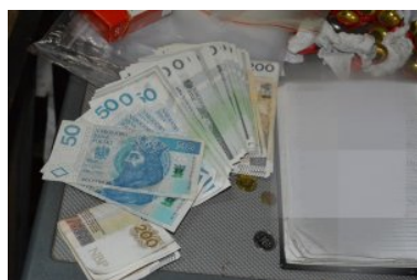
ujawnione wyroby akcyzowe

Ukraińskie i białoruskie papierosy, które trafiły do powiatu nowomiejskiego, zostały zabezpieczone, więc nie trafią na lokalny rynek. Łącznie zdeponowano blisko 190 tys. sztuk papierosów z przemytu oraz prawie 23 kg tytoniu do palenia. Funkcjonariusze z PSG w Olsztynie zabezpieczyli również gotówkę w kwocie 5 800 zł na poczet przyszłych kar.