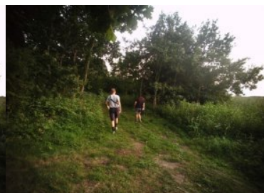
spacerowali z psami po pasie drogi granicznej