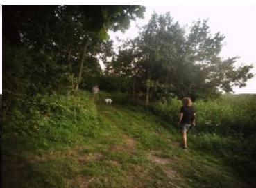
spacerowali z psami po pasie drogi granicznej