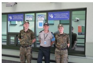
Śłużba litewskiego funkcjonariusza w Bezledach