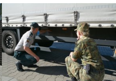
Śłużba litewskiego funkcjonariusza w Bezledach