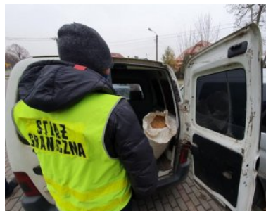
ujawniona krajanka tytoniowa

Dalsze czynności w sprawie prowadzą funkcjonariusze z Placówki Straży Granicznej w Braniewie.