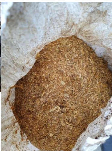
ujawniona krajanka tytoniowa