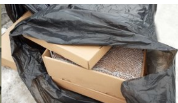
ujawnione nielegalne papierosy