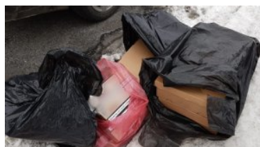
ujawnione nielegalne papierosy

Teraz mieszkanka powiatu olsztyńskiego i mężczyzna ze Zduńskiej Woli poniosą odpowiedzialność karno-skarbową.