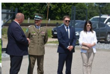
oficjalne otwarcie nowoczesnego skanera do prześwietlania wagonów towarowych