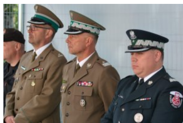
oficjalne otwarcie nowoczesnego skanera do prześwietlania wagonów towarowych

Wartość inwestycji to ponad 22 mln zł, w całości finansowana ze środków budżetowych.