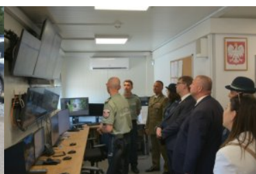
oficjalne otwarcie nowoczesnego skanera do prześwietlania wagonów towarowych