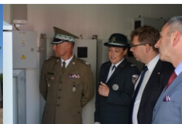
oficjalne otwarcie nowoczesnego skanera do prześwietlania wagonów towarowych