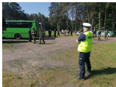
ćwiczenia „WARMIA 2021” wchodzącego w skład ćwiczenia „DRAGON-21”

Ćwiczenia miały za zadanie doskonalenie współdziałania funkcjonariuszy Warmińsko-Mazurskiego Oddziału Straży Granicznej z przedstawicielami Urzędu Wojewódzkiego w Olsztynie oraz z policjantami i żołnierzami, w przypadku pojawienia się na terenie województwa warmińsko-mazurskiego znacznej grupy cudzoziemców.