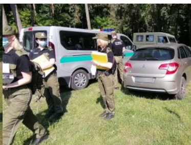
ćwiczenia „WARMIA 2021” wchodzącego w skład ćwiczenia „DRAGON-21”