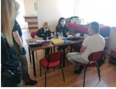
ćwiczenia „WARMIA 2021” wchodzącego w skład ćwiczenia „DRAGON-21”