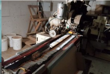
ujaniwone nielegalne towary