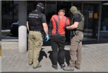
ujaniwone nielegalne towary