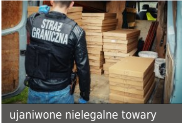
ujaniwone nielegalne towary