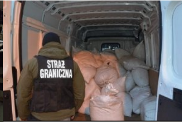
ujaniwone nielegalne towary