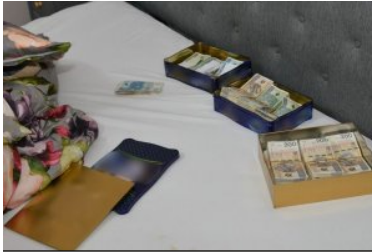
ujaniwone nielegalne towary