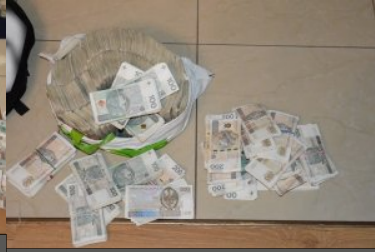
ujaniwone nielegalne towary