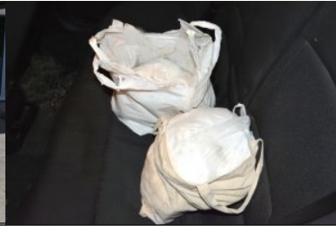
ujaniwone nielegalne towary