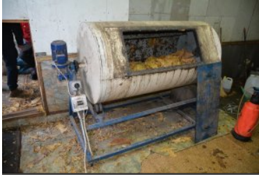
ujaniwone nielegalne towary