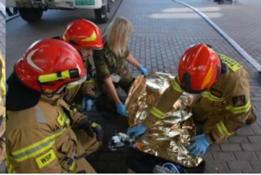
wspólne ćwiczenia służb na przejściu u Gronowie