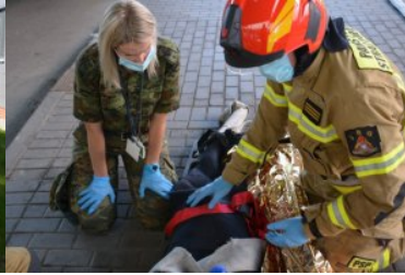
wspólne ćwiczenia służb na przejściu u Gronowie