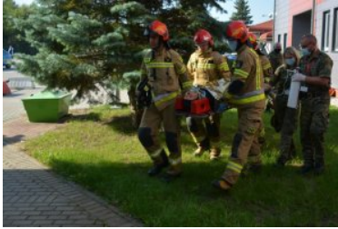
wspólne ćwiczenia służb na przejściu u Gronowie