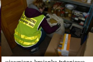
ujawniona krajanka tytoniowa