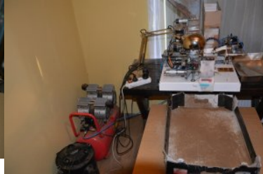
zabezpieczone urządzenia do produkcji papierosów