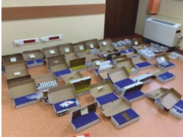
ujawnione nielegalne leki