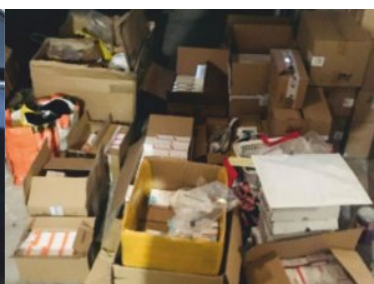
ujawnione nielegalne leki