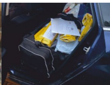
ujawnione nielegalne leki