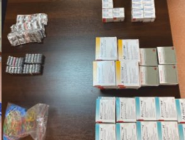
ujawnione nielegalne leki