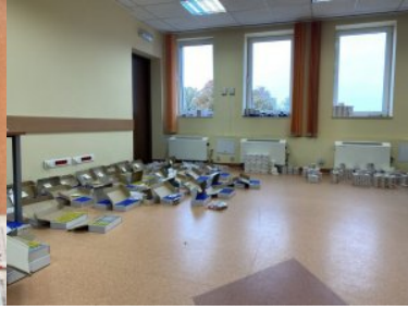
ujawnione nielegalne leki