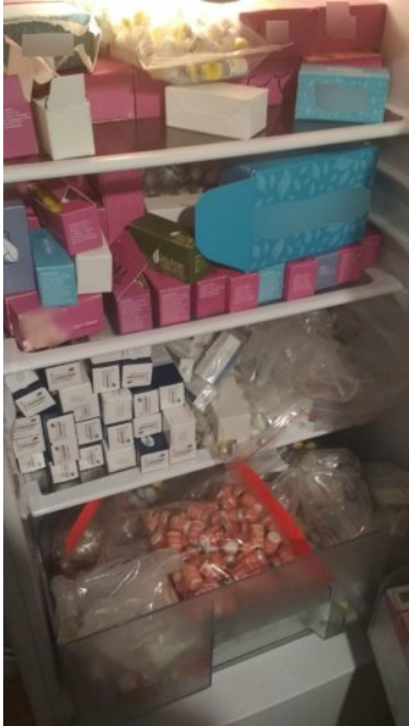
ujawnione nielegalne leki