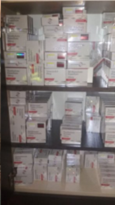
ujawnione nielegalne leki