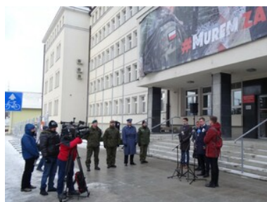
#Murem Za Polskim Mundurem