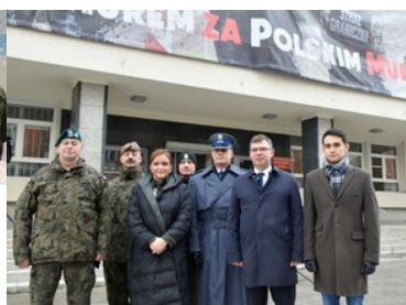
#Murem Za Polskim Mundurem