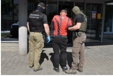
zatrzymany mężczyzna zamieszany w nielegalny biznes