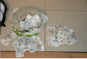
zabezpieczone środki finansowe