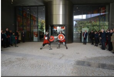
Otwarcie nowej siedziby Muzeum Bitwy pod Grunwaldem