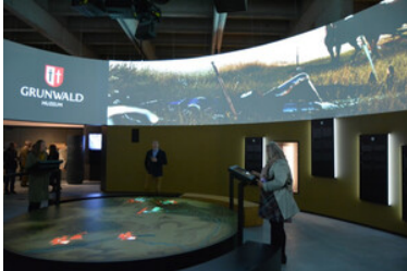
Otwarcie nowej siedziby Muzeum Bitwy pod Grunwaldem