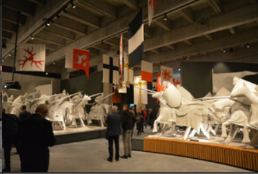
Otwarcie nowej siedziby Muzeum Bitwy pod Grunwaldem