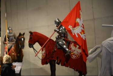
Otwarcie nowej siedziby Muzeum Bitwy pod Grunwaldem