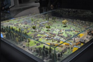
Otwarcie nowej siedziby Muzeum Bitwy pod Grunwaldem