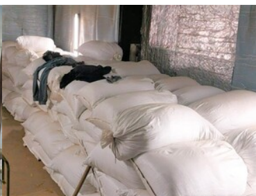
zlikwidowana fabryka papierosów i krajalnie tytoniu