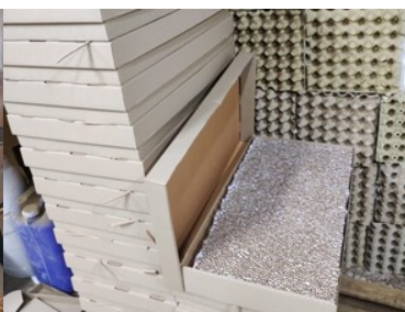
zlikwidowana fabryka papierosów i krajalnie tytoniu