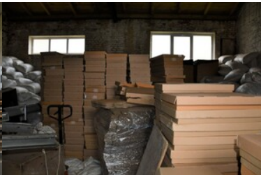
zlikwidowana fabryka papierosów i krajalnie tytoniu