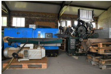
zlikwidowana fabryka papierosów i krajalnie tytoniu

Sprawa ma charakter rozwojowy. Dalsze czynności prowadzą funkcjonariusze z Warmińsko-Mazurskiego Oddziału Straży Granicznej i policjanci z Zarządu w Olsztynie Centralnego Biura Śledczego Policji.