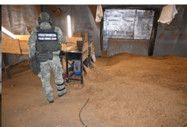
zlikwidowana fabryka papierosów i krajalnie tytoniu