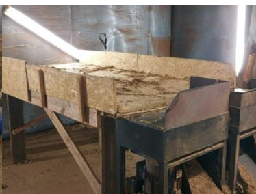
zlikwidowana fabryka papierosów i krajalnie tytoniu