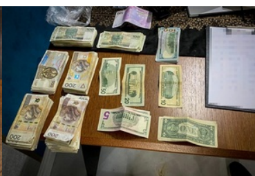
zlikwidowana fabryka papierosów i krajalnie tytoniu