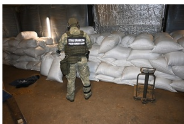
zlikwidowana fabryka papierosów i krajalnie tytoniu