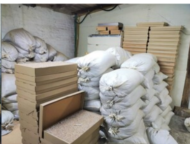
zlikwidowana fabryka papierosów i krajalnie tytoniu