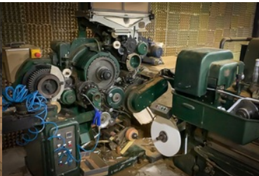
zlikwidowana fabryka papierosów i krajalnie tytoniu