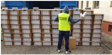
Przemycał papierosy uzbrojonym autem