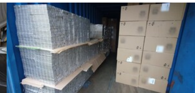
Przemycał papierosy uzbrojonym autem