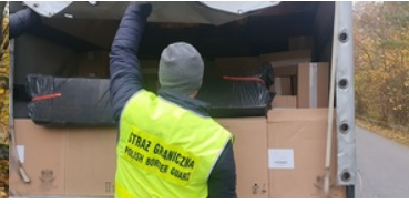
Przemycał papierosy uzbrojonym autem