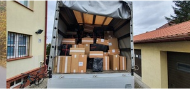
Przemycał papierosy uzbrojonym autem