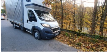
Przemycał papierosy uzbrojonym autem

21 października, Sąd Rejonowy w Suwałkach, na wniosek prokuratora zastosował wobec mężczyzny środek zapobiegawczy w postaci tymczasowego aresztowania na okres trzech miesięcy.