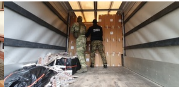
Przemycał papierosy uzbrojonym autem