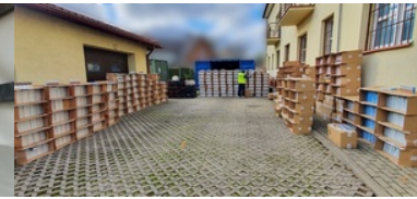
Przemycał papierosy uzbrojonym autem