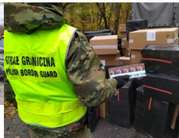
Przemycał papierosy uzbrojonym autem