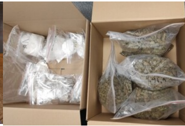
Zabezpieczone nielegalne towary