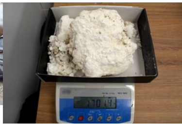
Zabezpieczone nielegalne towary