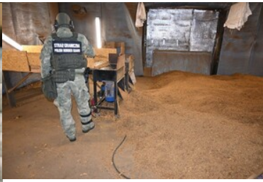
Zabezpieczone nielegalne towary