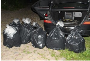
Zabezpieczone nielegalne towary