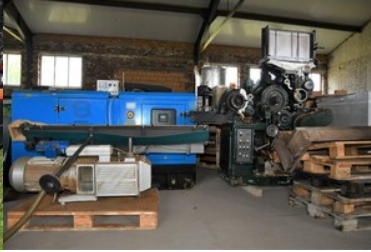
Zabezpieczone nielegalne towary