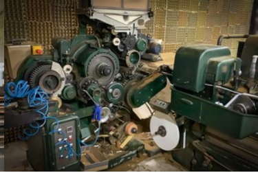
Zabezpieczone nielegalne towary