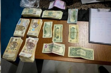
Zabezpieczone nielegalne towary