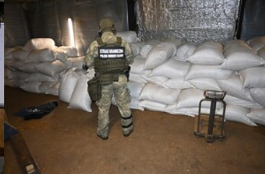
Zabezpieczone nielegalne towary