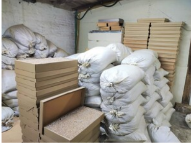
Zabezpieczone nielegalne towary