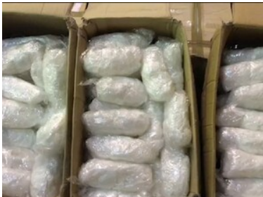
Zabezpieczone nielegalne towary