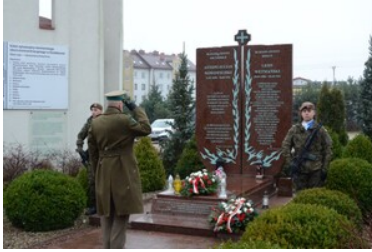
Obchody Dnia Pamięci Ofiar Obu Totalitaryzmów na Warmii i Mazurach