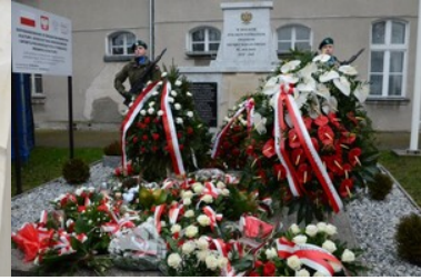
Obchody Dnia Pamięci Ofiar Obu Totalitaryzmów na Warmii i Mazurach