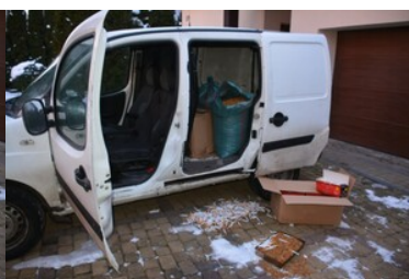
ujawnione wyroby akcyzowe