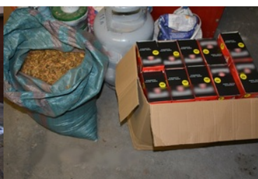
ujawnione wyroby akcyzowe