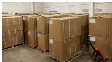
Służby zabezpieczyły 16 ton krajanki tytoniowej

Gdyby tytoń trafił do sprzedaży, Skarb Państwa straciłby prawie 18 mln złotych.