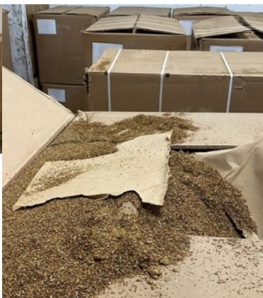
Służby zabezpieczyły 16 ton krajanki tytoniowej