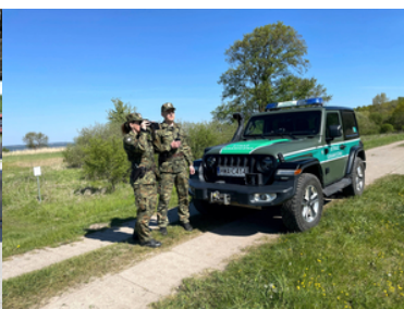
Nabór do służby