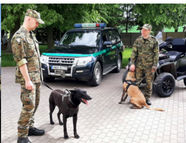
Nabór do służby