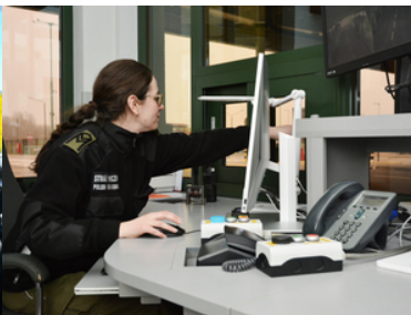
Nabór do służby