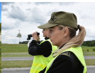
Nabór do służby