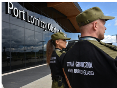
Nabór do służby