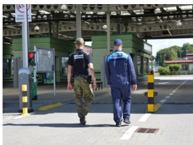
Nabór do służby