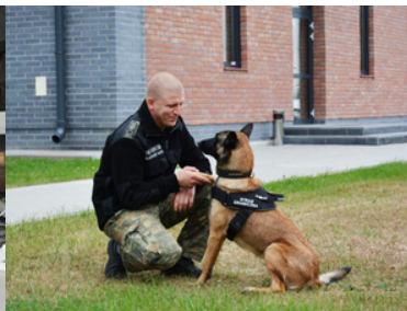
Nabór do służby