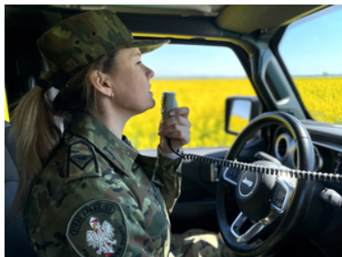
Nabór do służby