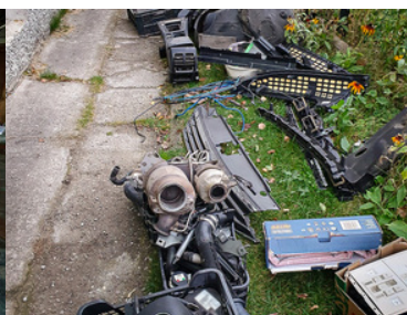
ujawnione części pojazdu