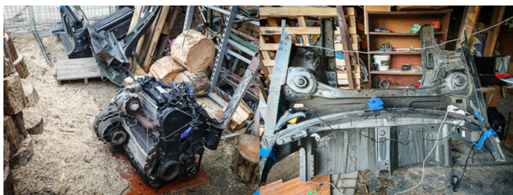
ujawnione części pojazdu

37-latek przyznał się do posiadania podzespołów VW Passata. Właściciela posesji zatrzymano. Dalsze czynności w sprawie prowadzą policjanci z CBŚP w Olsztynie.