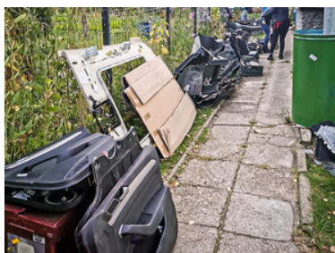
ujawnione części pojazdu