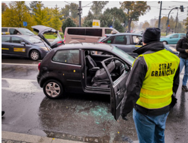
Rozbili zorganizowaną grupę przestępczą

Podejrzany grozi kara do 12 lat pozbawienia wolności.