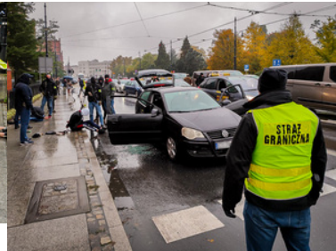
Rozbili zorganizowaną grupę przestępczą