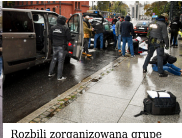
Rozbili zorganizowaną grupę przestępczą