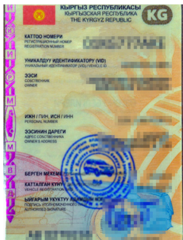
podrobiony kirgiski dowód rejestracyjny

Mężczyzna przyznał się do posłużenia podrobionym dowodem rejestracyjnym. Został ukarany grzywną w wysokości 1 500 zł.