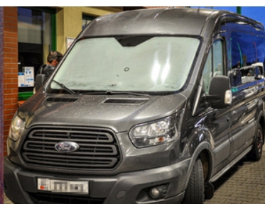
wymienione tablice w fordzie