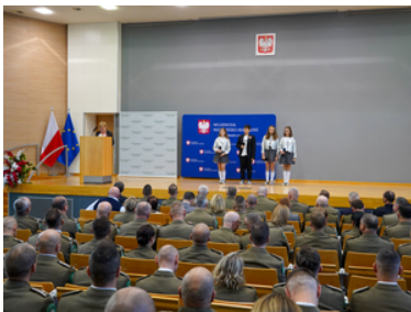
Awanse, wyróżnienia z okazji Święta Niepodległości