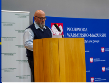
Awanse, wyróżnienia z okazji Święta Niepodległości