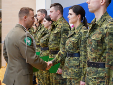
Awanse, wyróżnienia z okazji Święta Niepodległości