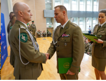
Awanse, wyróżnienia z okazji Święta Niepodległości