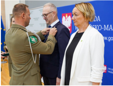
Awanse, wyróżnienia z okazji Święta Niepodległości