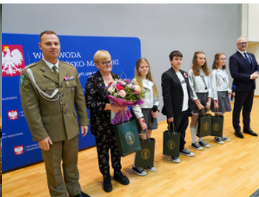
Awanse, wyróżnienia z okazji Święta Niepodległości