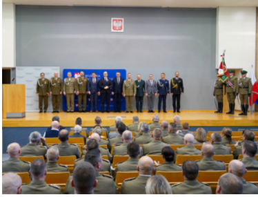
Awanse, wyróżnienia z okazji Święta Niepodległości