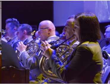
koncert Orkiestry Reprezentacyjnej SG z okazji 100-lecia powołania KOP