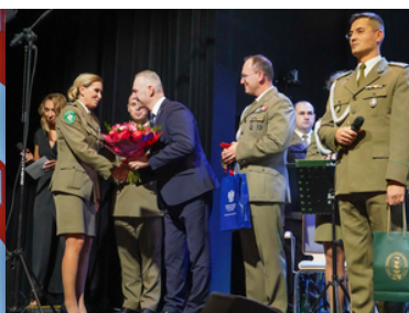
koncert Orkiestry Reprezentacyjnej SG z okazji 100-lecia powołania KOP