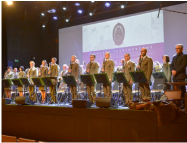
koncert Orkiestry Reprezentacyjnej SG z okazji 100-lecia powołania KOP