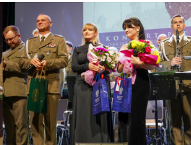
koncert Orkiestry Reprezentacyjnej SG z okazji 100-lecia powołania KOP