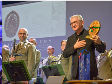
koncert Orkiestry Reprezentacyjnej SG z okazji 100-lecia powołania KOP