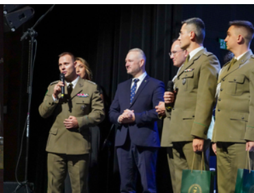
koncert Orkiestry Reprezentacyjnej SG z okazji 100-lecia powołania KOP