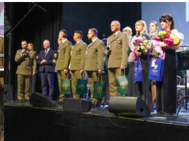
koncert Orkiestry Reprezentacyjnej SG z okazji 100-lecia powołania KOP