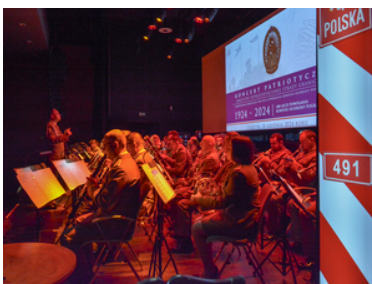
koncert Orkiestry Reprezentacyjnej SG z okazji 100-lecia powołania KOP