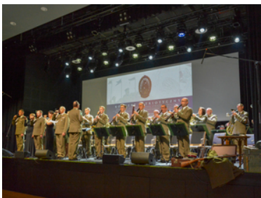
koncert Orkiestry Reprezentacyjnej SG z okazji 100-lecia powołania KOP