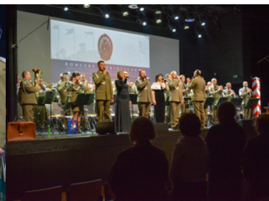
koncert Orkiestry Reprezentacyjnej SG z okazji 100-lecia powołania KOP