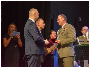
koncert Orkiestry Reprezentacyjnej SG z okazji 100-lecia powołania KOP