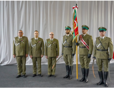
Pożegnanie z mundurem po ponad 42 i 33 latach służby