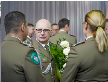
Pożegnanie z mundurem po ponad 42 i 33 latach służby