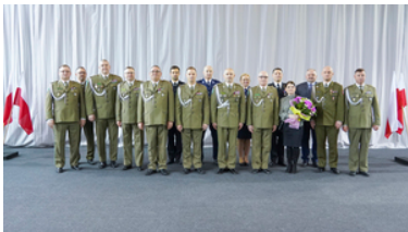
Pożegnanie z mundurem po ponad 42 i 33 latach służby