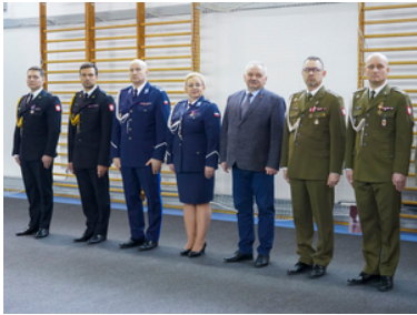
Pożegnanie z mundurem po ponad 42 i 33 latach służby