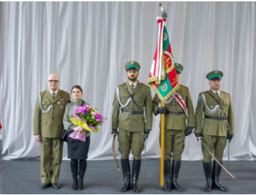
Pożegnanie z mundurem po ponad 42 i 33 latach służby