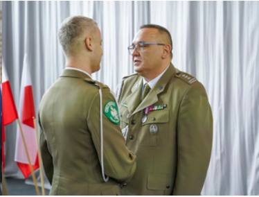
Pożegnanie z mundurem po ponad 42 i 33 latach służby