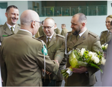
Pożegnanie z mundurem po ponad 42 i 33 latach służby