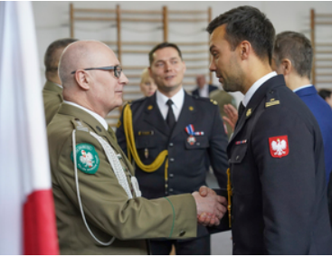
Pożegnanie z mundurem po ponad 42 i 33 latach służby