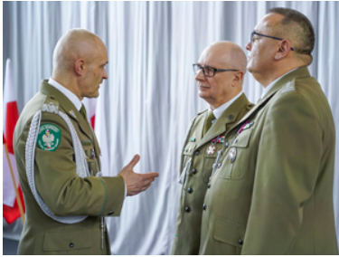
Pożegnanie z mundurem po ponad 42 i 33 latach służby