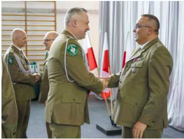
Pożegnanie z mundurem po ponad 42 i 33 latach służby