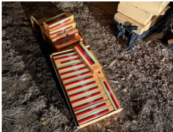
ujawnione nielegalne papierosy