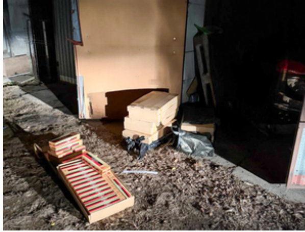
ujawnione nielegalne papierosy