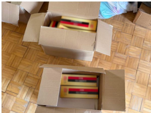
ujawnione nielegalne papierosy