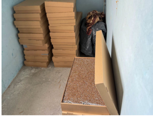
ujawnione nielegalne papierosy