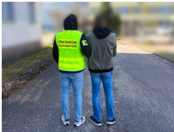
zatrzymany mężczyzna, zamieszany w handel nielegalnymi papierosami