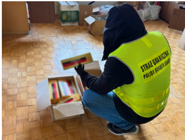
ujawnione nielegalne papierosy