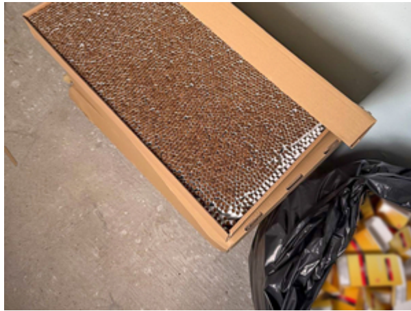
ujawnione nielegalne papierosy